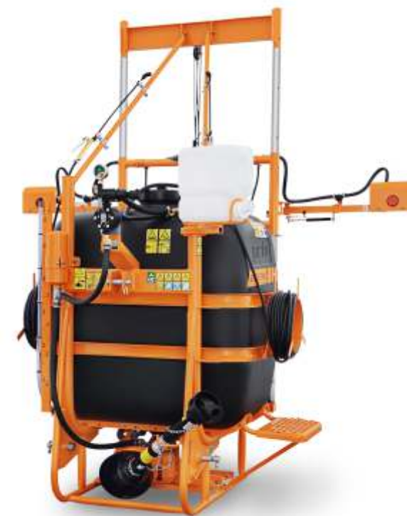
CONDOR BC 610 PEC