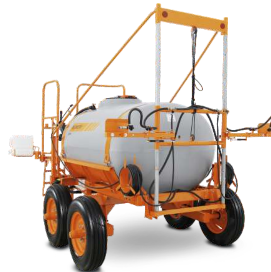
CORAL PEC BC