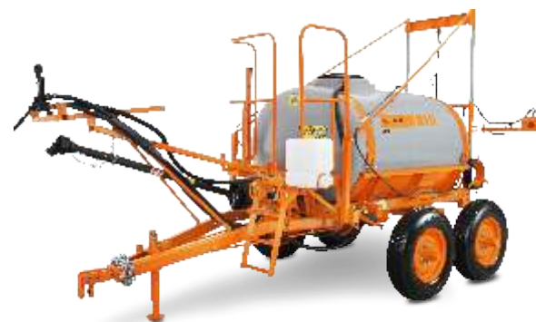
CORAL PEC BC